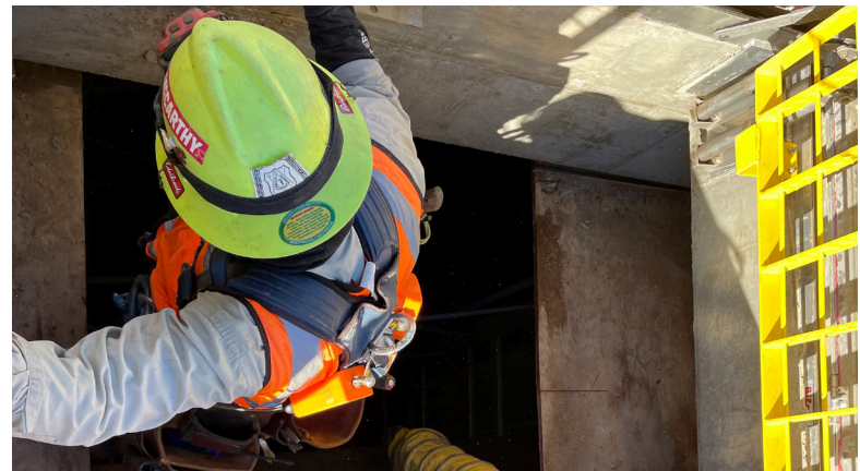
Las cuadrillas trabajando en el interior del pozo húmedo y las estructuras de la bóveda de válvulas, que forman parte de la estación de bombeo de aguas pluviales.

MANTÉNGASE CONECTADO Línea directa de construcción 800.679.9570 www.JurupaGradeSeparation.com